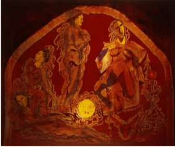
Resim-3 Eserin Adı: Afroditler Ebatı: 100*81 Teknik: Akrilik Yıl:1998

Eserde başının üzerinden düğümlemiş ipler sarkan savaşı bir kızılderiliye benzetilen kadın figürü ile sanatçı, hayatta karşılaşılan travmalar, sıkıntıları ile kendisine biçilen rolleri, sorumluluklarla, ayakta kalmak için savaşan kadının bu dünyada var olma mücadelesini ve çözümsüz olaylarla birbirine karışmış düğüm düğüm olmuş hayatını anlatmak istemiştir. Sanatçı eserde gözlerde kullanılan sarı renkle olumsuzluklara ve şiddete özellikle dikkat çekmek istemiştir. Kırmızı renklerle de yaşanan o kaosu içinde figürün alev alev yandığını bize göstermektedir ( Resim-2).