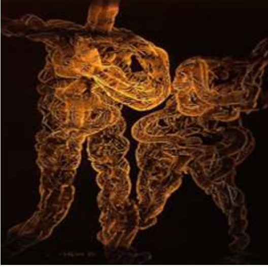
Resim-1 Eserin Adı: Michelangelo'ya Saygı Ebatı: 81*100 Teknik: Akrilik Yıl:1996

Resmin Analizi: Eserde bir kadın, bir erkek figürü sarmal bir hâlde resmedilmiştir. Karşılıklı olarak birbirlerine dönmüş bu figürlerden, erkek figürü yüzünü arkaya doğru çevirmişken kadın figürü önüne doğru başını eğmiş bir şekilde çizilmiştir. Yüzler ise resimde belirtilmemiştir. Eserde siyah, sarı ve turuncu renkler kullanılmıştır.