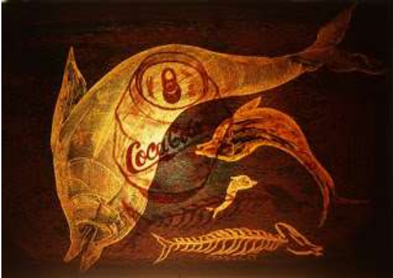
Resim-5 Eserin Adı: Poseidon Endüstriye Teslim Ebatı:100*72 Teknik: Akrilik Yıl:1998

Resmin yorumu: Eserin adı Hephaistos'dur. Çekiç ve örs Yunan mitolojisinde Hephaistos'un simgesidir. Hephaistos ateşin tanrısı olup yanardağlara bile hükmetmiştir. Eserde çekiç ve örsü bir televizyon ekranı çevrelemiştir. İnsanlar el emeğiyle hayat mücadelesi verirken teknolojinin hayatımıza girmesiyle, aslında hayatımızı kolaylaştırırken farkedilmeden etrafımızı çepeçevre sardığı da anlatılmıştır. Sanatçı teknoloji ile internet ortamındaki kaosun insan psikolojisindeki etkileri yanında çekiç ve örs ile insanların kendi emekleriyle, hayat mücadelesi arasındaki kısır döngüye vurgu yapmıştır. Bu kısır döngü içindeki sıkıntılar koyu renkte gösterilmiştir. (Resim-4)