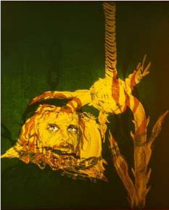
Resim-7 Eserin Adı: Prometheus Ebatı: 81*100 Teknik: Akrilik Yıl:1998

Resmin yorumu: Esere adını veren Şahmeran figürü, kadın başlı bir yılan, yılanların kraliçesi olarak eserde yer almıştır. Eserde arka planda yer alan ve tahtta oturan bu kadın figürü aslında kendi dünyasında oldukça mutludur. Resmin ön planında yer alan erkek figürleriyle de belli mesafeler çerçevesinde bir ilişki içinde bulunmaktadır. Sanatçının çalışmasına ismini verdiği Şahmeran hikayesinden de anlaşılacağı üzere kadın erkek ilişkilerindeki belli mesafelerin olmasıyla sadece huzurun olabileceğine dikkat çekilmek istenmiştir(Resim 6 )