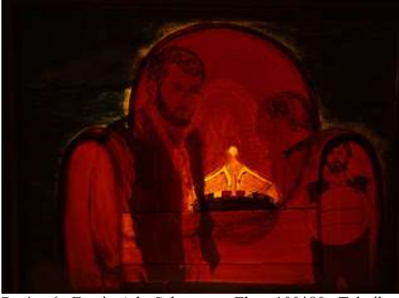
Resim-6 Eserin Adı: Şahmeran Ebatı:100*80 Teknik: Akrilik Yıl:1996

Resmin analizi: Eserde üzerinde taç bulunan bir koltuk, koltuğun kollarında farklı boyutlarda erkek figürleri, tacın üzerinde yüzü bize dönük bir kadın portresi yer almaktadır. Eserde sarı, turuncu, kırmızı renkler kullanılmıştır.