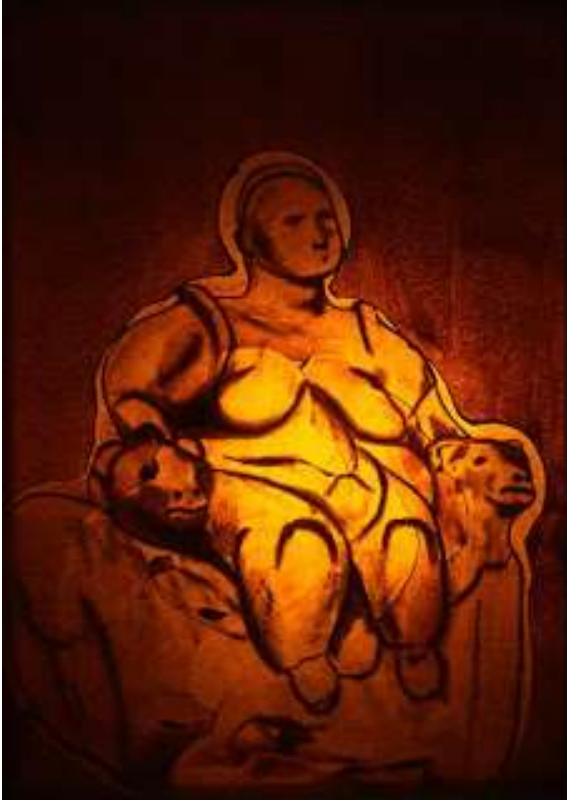
Resim-8 Eserin Adı: Kibele Ebatı: 81*100 Teknik: Akrilik Yıl:1998

kendi değer yargıları, istek ve arzularıyla, kendi doğrularıyla yaşarken yüklenen toplumsal roller, düşünce ve değer yargılarıyla eleştirilen, dışlanan, ötelenen insanı anlatmıştır. İnsanın bu sebeplerle mahkum edilişi resimde kullanılan renklerle de pekiştirilmiştir (Resim 7 )